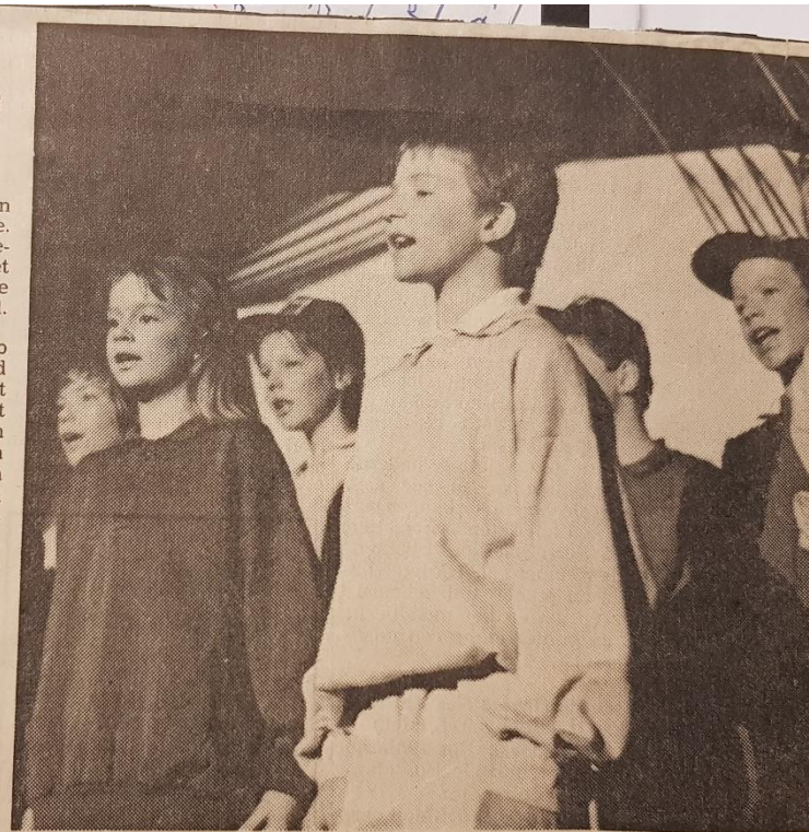
Het 25-jarig bestaan van de Biddinghuizer Gereformeerde en Hervormde Gemeente werd zon-

Velen waren dan ook op de eerste avond teleurgesteld, dat de tweede avond ook totaal uitverkocht was, want men wilde het nog wel een keer meemaken. Iedere bezoeker kreeg een kaars mee, symboliserend het licht dat straalt en bij het aanschouwen hiervan goede herinneringen heeft.