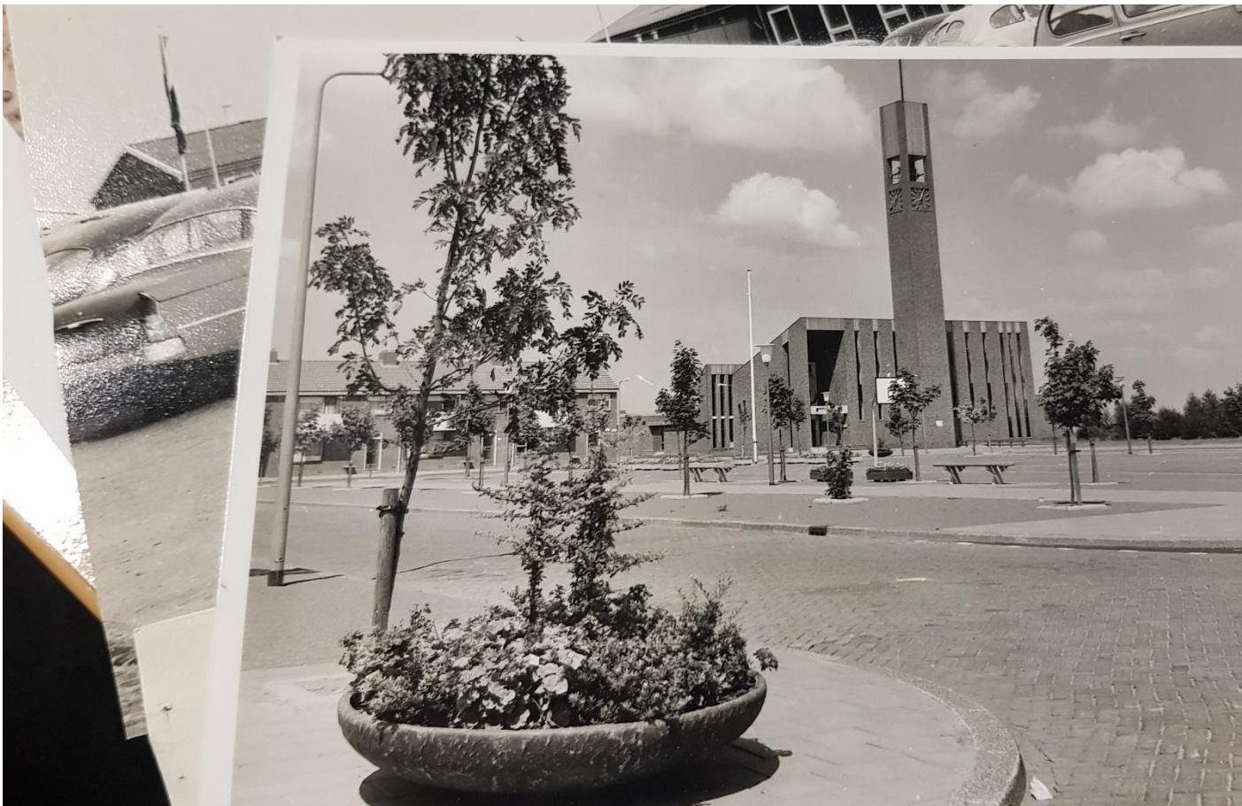
Aanzichtsfoto kerk de Voorhof