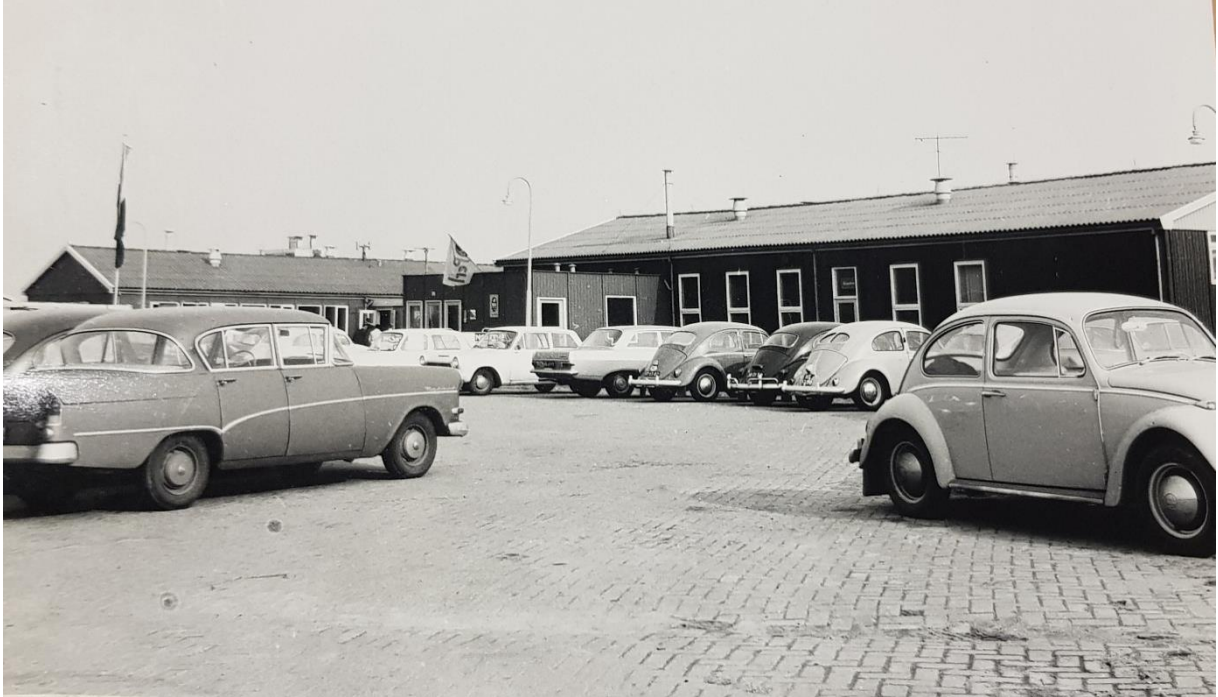
Foto van de barakken van Biddinghuizen

Uit 'Het Nieuwe Kerkblad': Enquete voor de jeugd over samenwonen